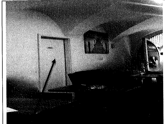
Automatenraum erste Eingang – danach noch eine Tür - manuell vom Personal aufgesperrt