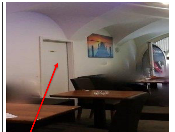
Automatenraum erste Eingang – danach noch eine Tür - manuell vom Personal aufgesperrt