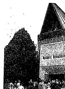
Die Gedenkstätte wu 50 Jahren eingeweiht

den Karst (heutiges Slowenien). Diese deutsche Sprachinsel bestand bis 1941, ehe die Bewohner nach Krško umgesiedelt wurden und 1945 von dort wieder fliehen mussten. 1967 wurde die Mariatroster Gedenkstätte errichtet, in der sich die in alle Welt verstreute Volksgruppe präsentiert.