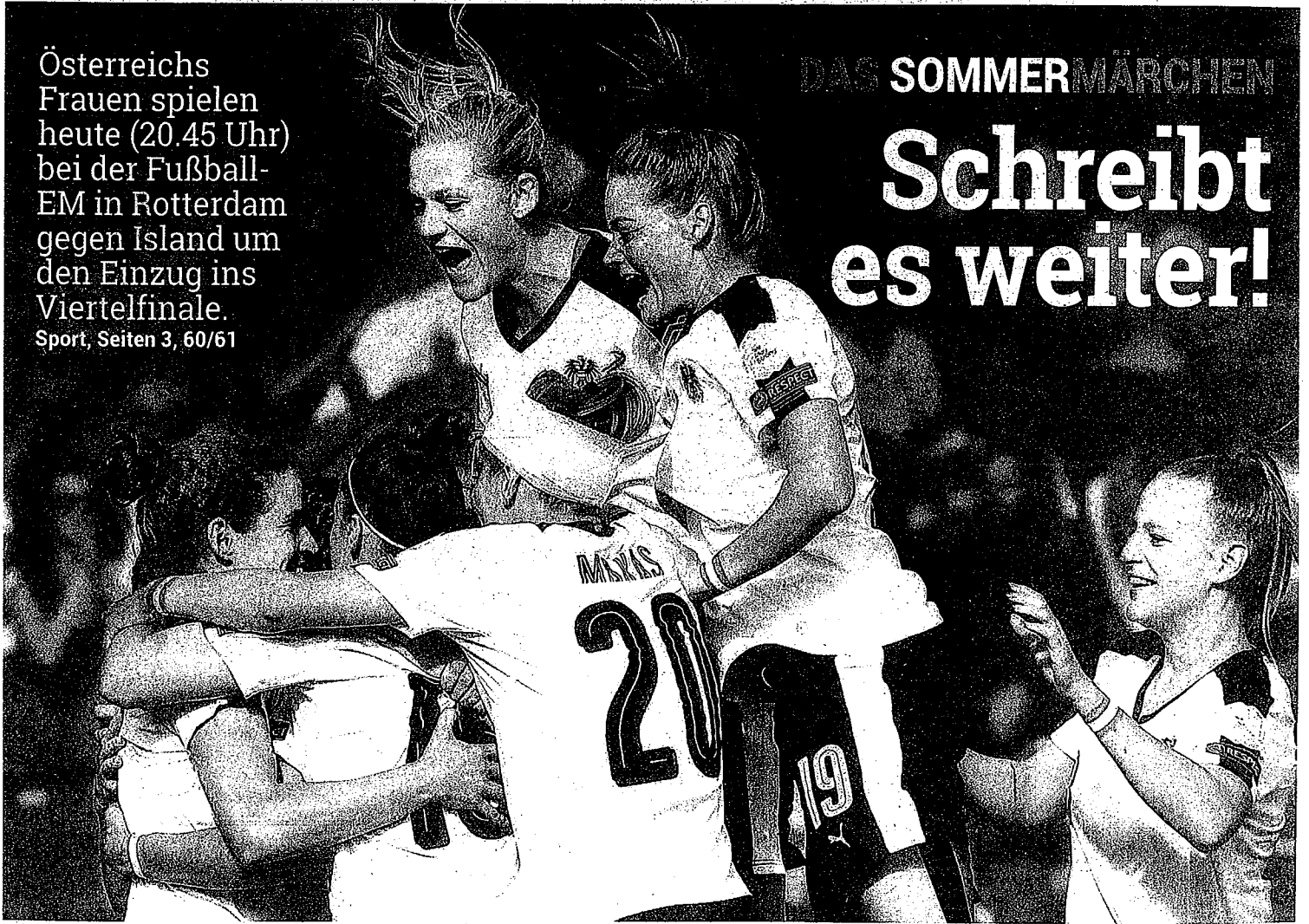
APA, FOTOLIA, NETFLIX